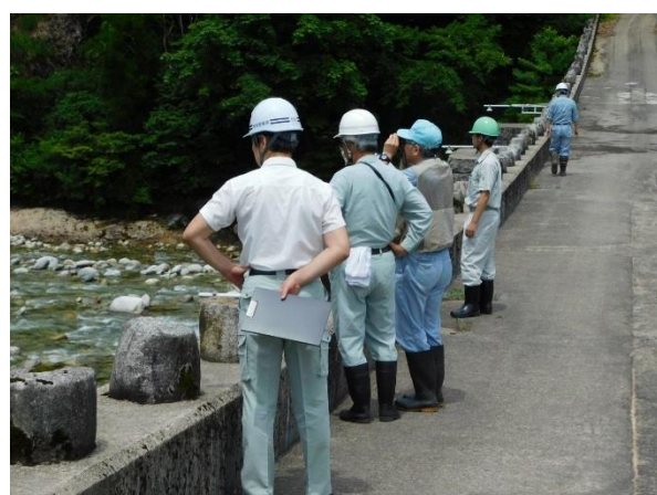
玉川スーパー暗渠砂防堰堤 点検状況