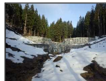
穴沢第2号砂防堰堤