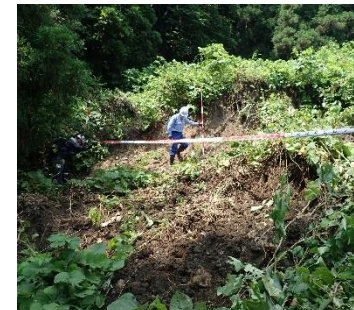
↑ 上流で確認された法面崩壊