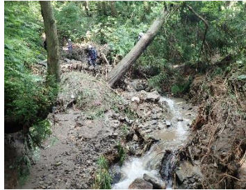
↑ 上流の溪流の状況