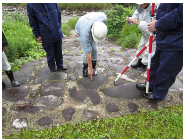
荒川流路工(階段護岸工)点検状況