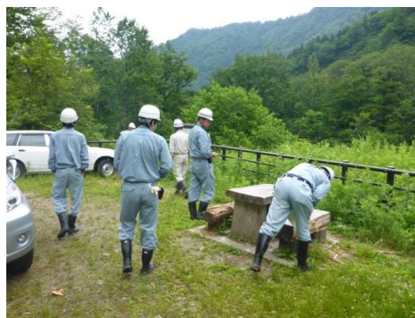
梅花皮沢第4号砂防堰堤(下流広場)点検状況