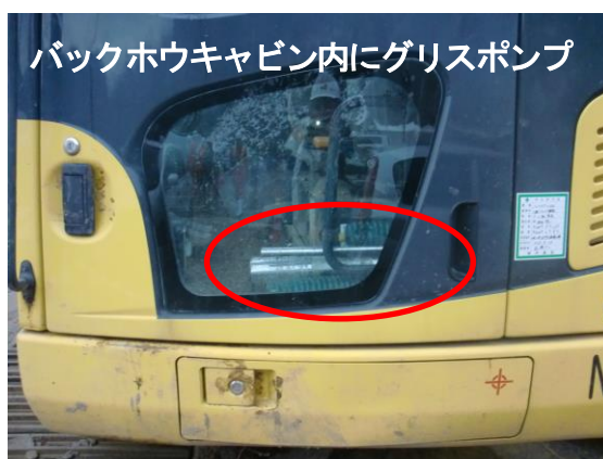
バックホウキャビン内にグリスポンプ