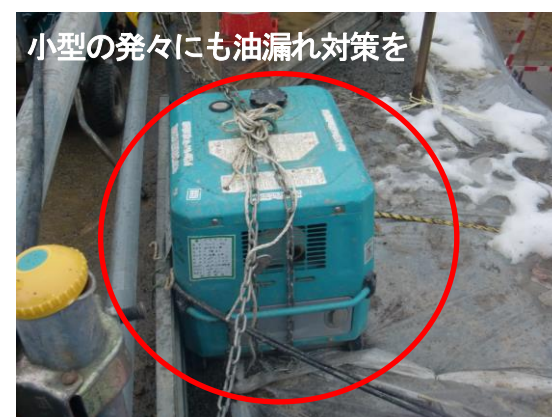
小型の発々にも油漏れ対策を