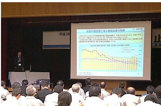
工事事故の発生状況と安全管理について