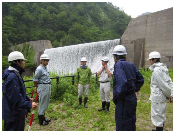
昨年度の実施状況（左：玉川スーパー暗渠、右：梅花皮沢第4号砂防堰堤）