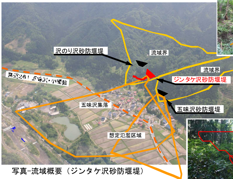
写真-流域概要（ジントケ沢砂防堰堤）