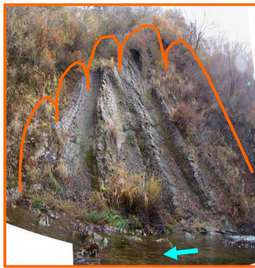
写真-上流溪岸部の法面状況