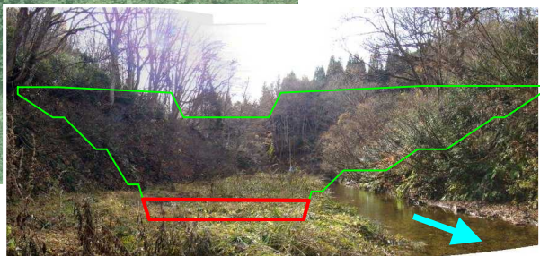
写真-砂防堰堤施工予定箇所