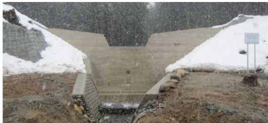
写真-施工箇所（五味沢砂防堰堤）