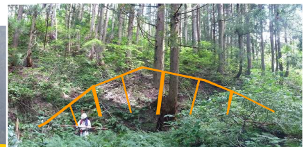
写真-上流溪岸部の崩壊状況