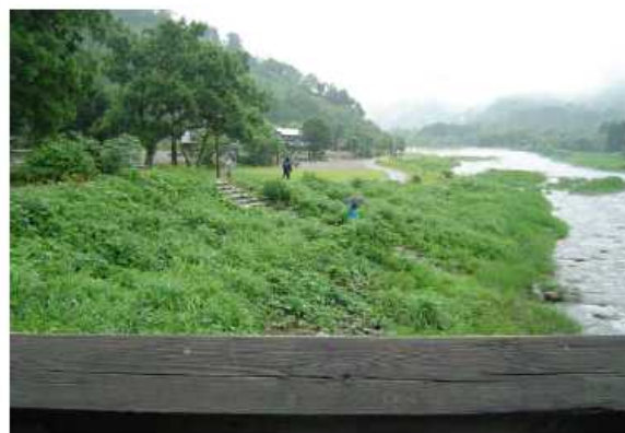
昨年の実施状況（荒川流路工）