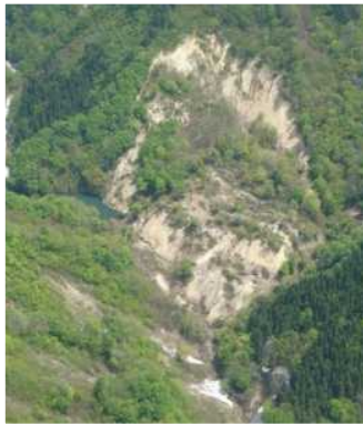
写真-大規模土砂崩壊