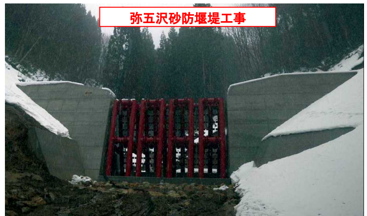
弥五沢砂防堰堤工事