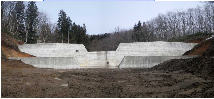
奥ノ院砂防堰堤工事