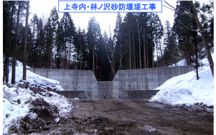
上寺内・林ノ沢砂防堰堤工事