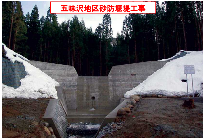
五味沢地区砂防堰堤工事