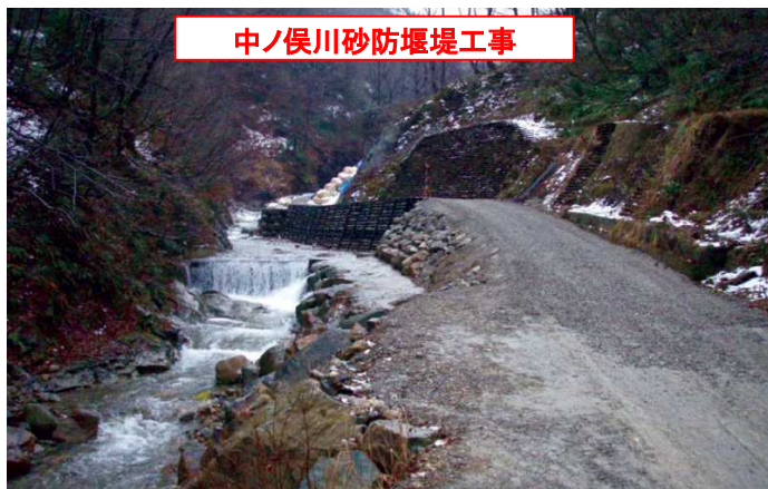
中ノ俣川砂防堰堤工事