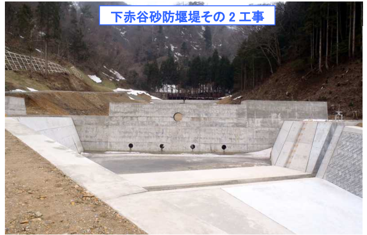
下赤谷砂防堰堤その 2 工事