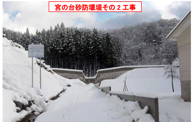
宮の台砂防堰堤その 2 工事