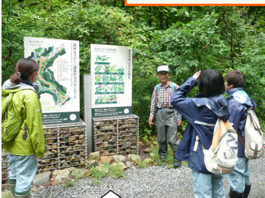
森林セラピーの様子