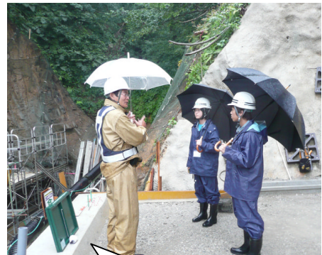
工事現場視察の様子