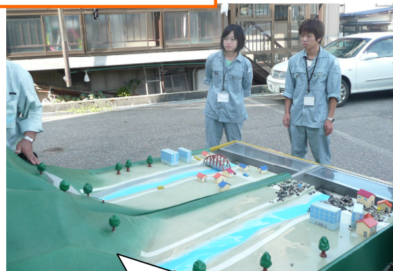
土石流模型実験装置の実演