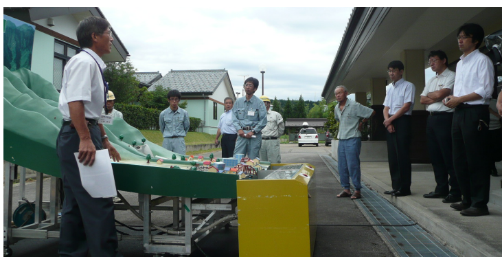
土石流模型実験装置の実演状況（H23年度）