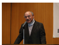
協議会副会長の閉会挨拶