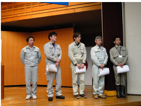
優秀論文受賞者の皆さん