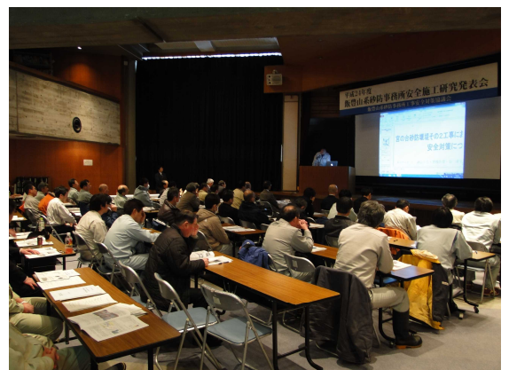
安全施工研究論文の発表・質疑