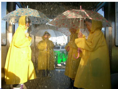
左上：降雨体験装置全景 上：土石流模型実験装置 左：降雨体験状況