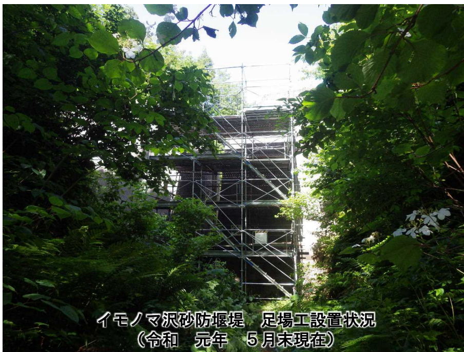
イモノマ沢砂防堰堤 足場工設置状況 (令和元年5月末現在)