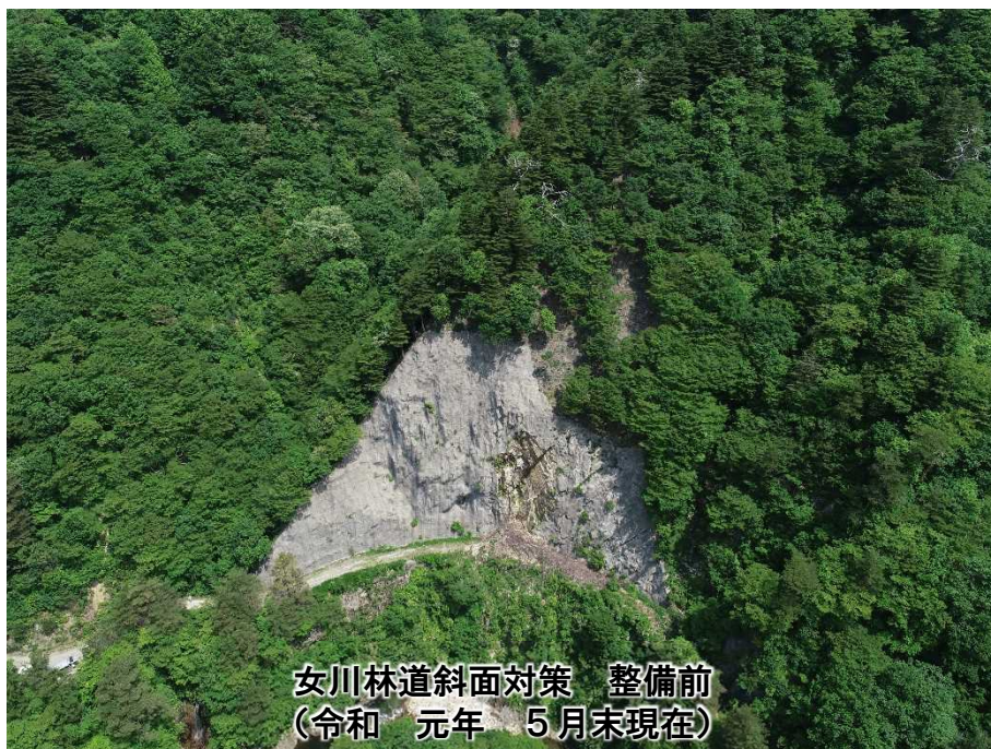
女川林道斜面对策 整備前 (令和元年5月末現在)

岩船郡関川村小和田地先の右岸側管理用道路(女川林道)において、斜面对策工を整備しています。