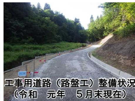
工事用道路(路盤工)整備状況 (令和元年5月末現在)