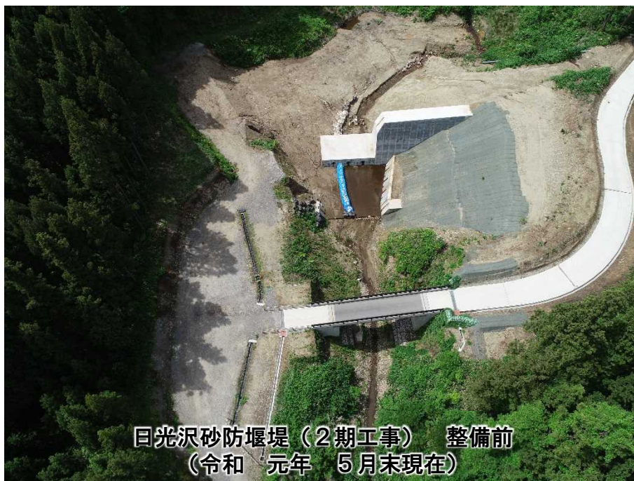
日光沢砂防堰堤(2期工事) 整備前 (令和元年5月末現在)

新発田市下中山地先の加治川水系坂井川支溪日光沢において、砂防堰堤(2期工事)を整備しています。