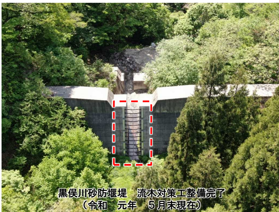
黒俣川砂防堰堤 流木対策工整備完了 (令和元年5月末現在)