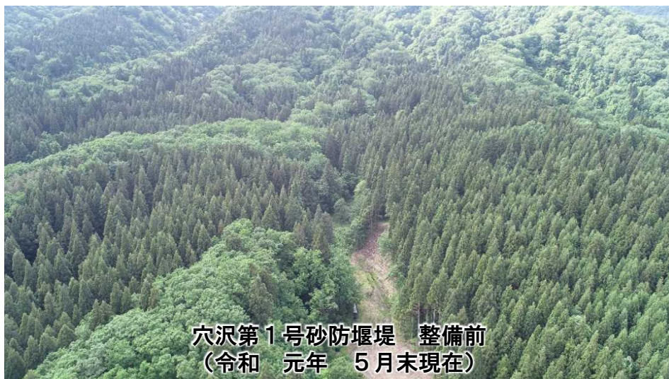
穴沢第1号砂防堰堤 整備前 (令和元年5月末現在)