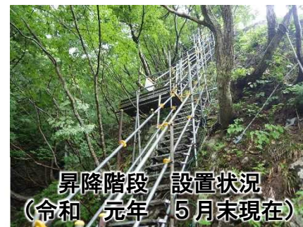
昇降階段 設置状況 (令和元年5月末現在)