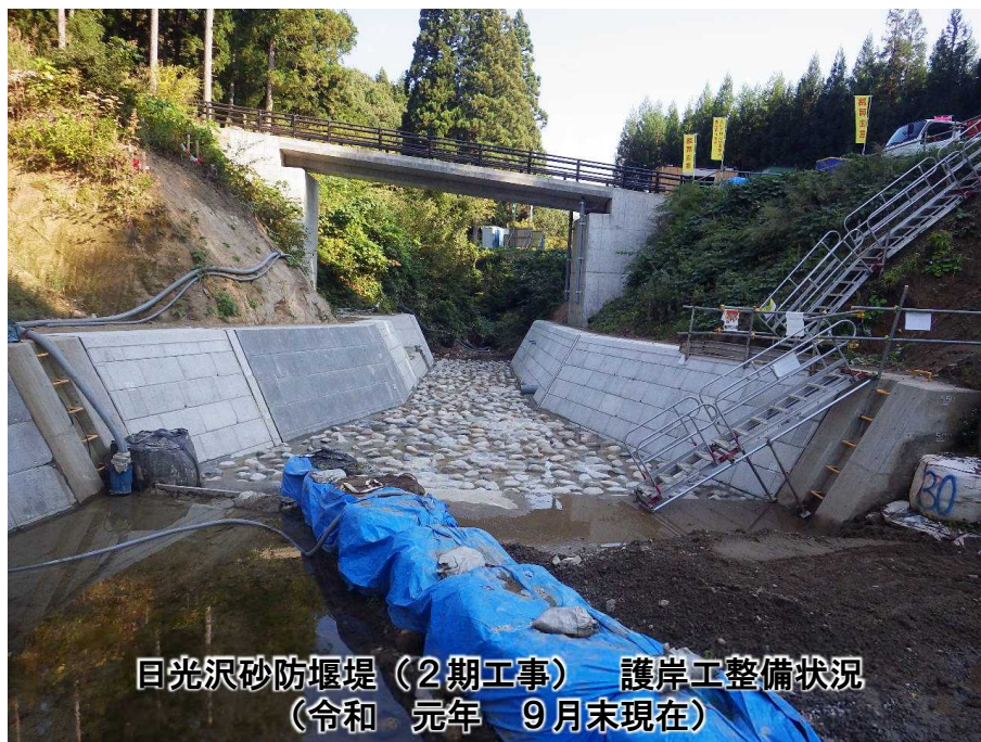
日光沢砂防堰堤(2期工事) 護岸工整備状況 (令和 元年 9月末現在)

新発田市下中山地先の加治川水系坂井川支溪日光沢において、砂防堰堤(2期工事)を整備しています。