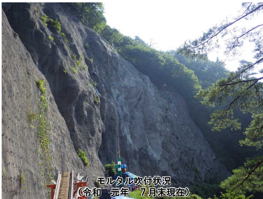
モルタル吹付状況 (令和元年7月末現在)

岩船郡関川村小和田地先の右岸側管理用道路(女川林道)において、斜面对策工を整備しています。