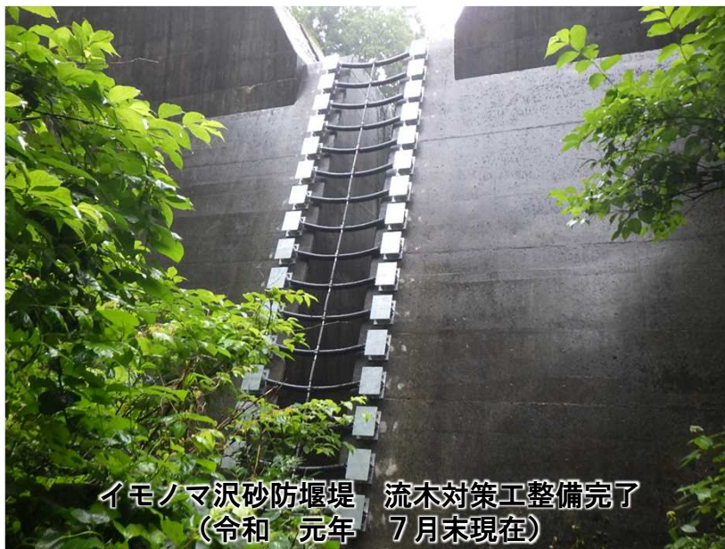
イモノマ沢砂防堰堤 流木対策工整備完了 (令和元年7月末現在)