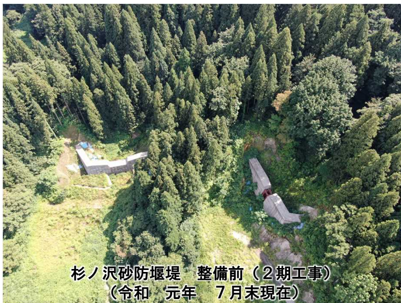
杉ノ沢砂防堰堤 整備前（2期工事） (令和元年7月末現在)