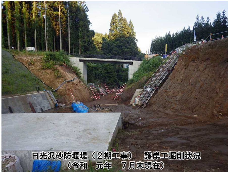
日光沢砂防堰堤(2期工事) 護岸工掘削状況 (令和元年7月末現在)

新発田市下中山地先の加治川水系坂井川支溪日光沢において、砂防堰堤(2期工事)を整備しています。