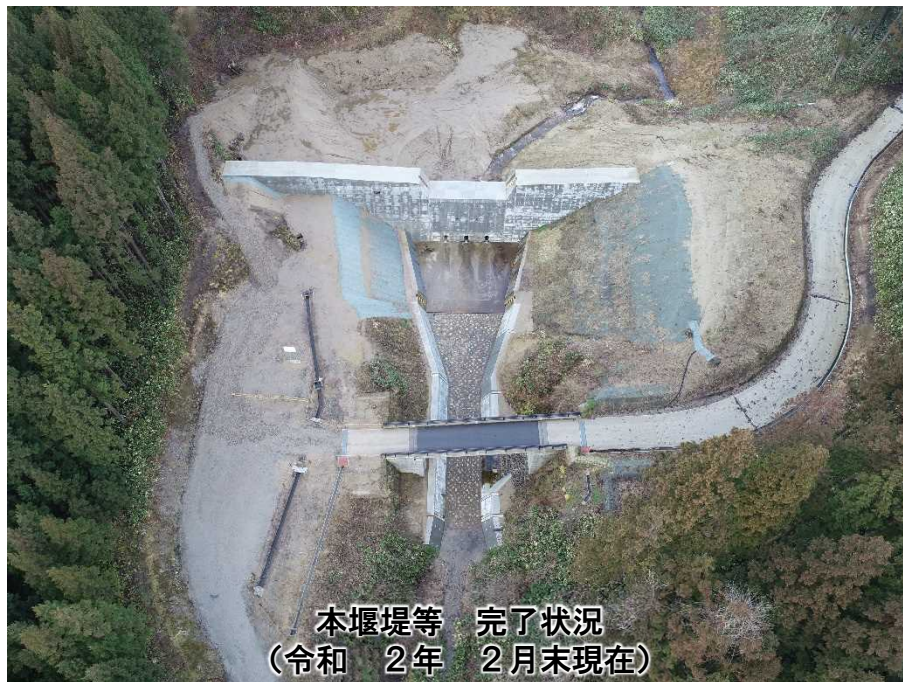
本堰堤等 完了状況 (令和 2年 2月末現在)

新発田市下中山地先の加治川水系坂井川支溪日光沢において、砂防堰堤(2期工事)を整備しました。