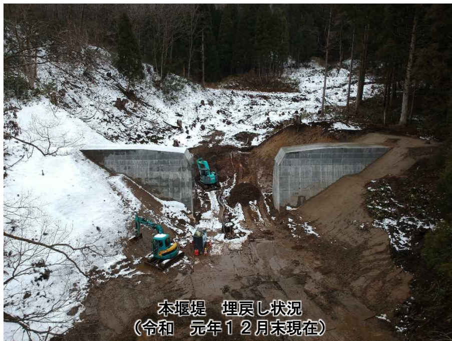
本堰堤 埋戻し状況 (令和 元年12月末現在)