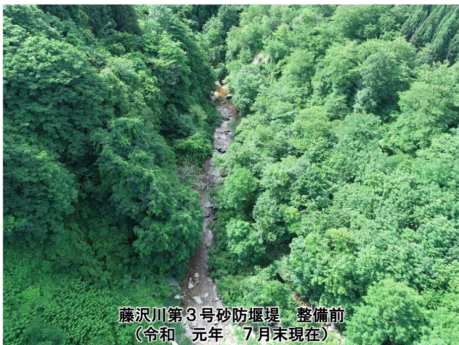
藤沢川第3号砂防堰堤 整備前 (令和 元年 7月末現在)