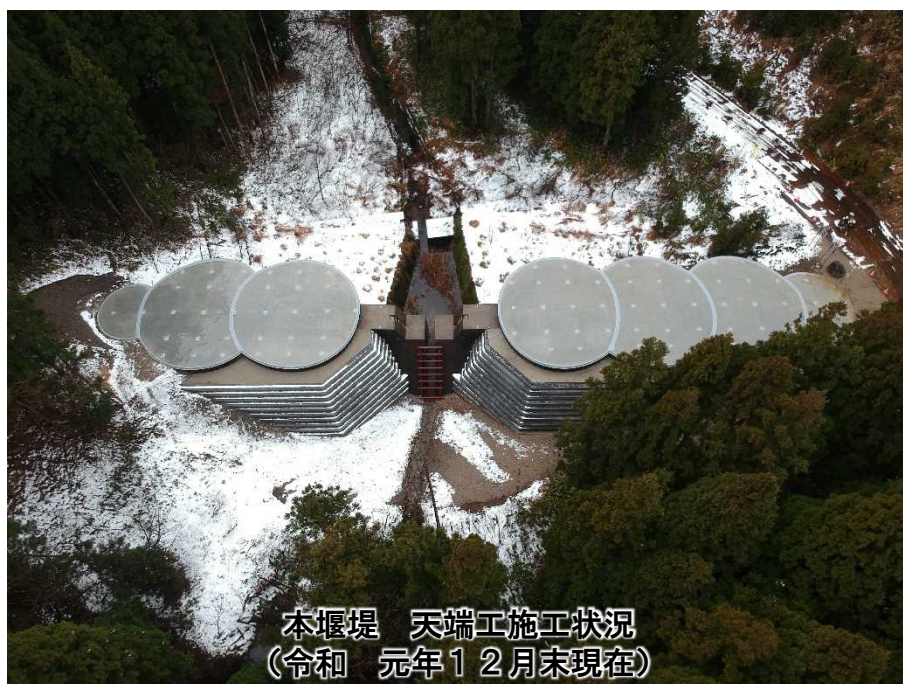
本堰堤 天端工施工状況 (令和 元年12月末現在)