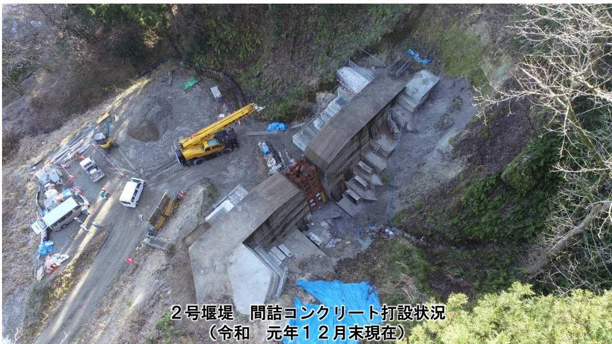
2号堰堤 間詰コンクリート打設状況 (令和元年12月末現在)