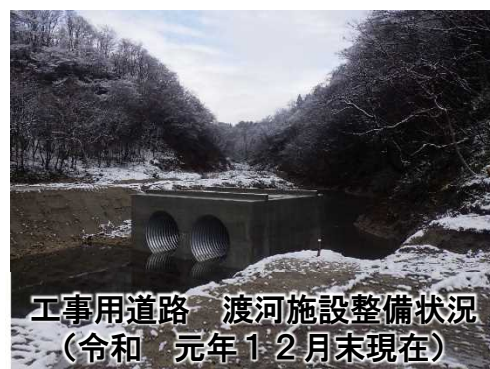
工事用道路 渡河施設整備状況 (令和 元年 1-2月末現在)