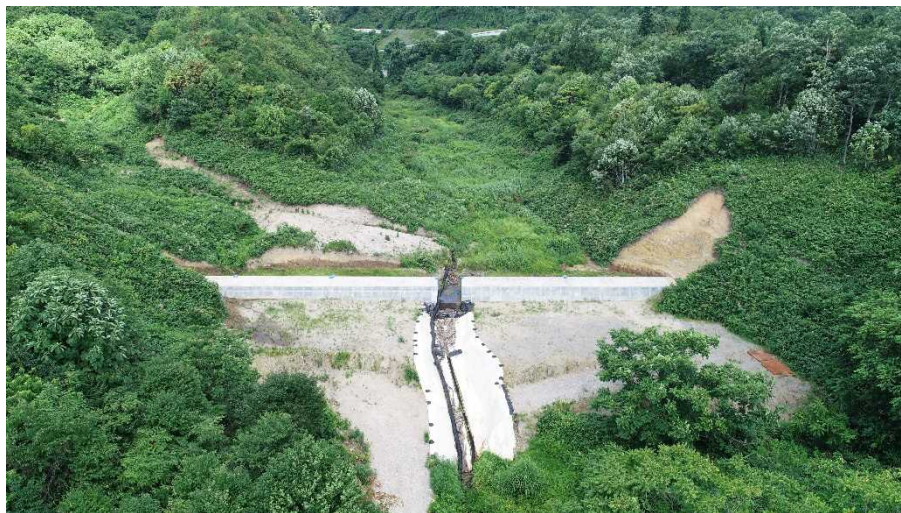
平成30年8月3日着手前写真