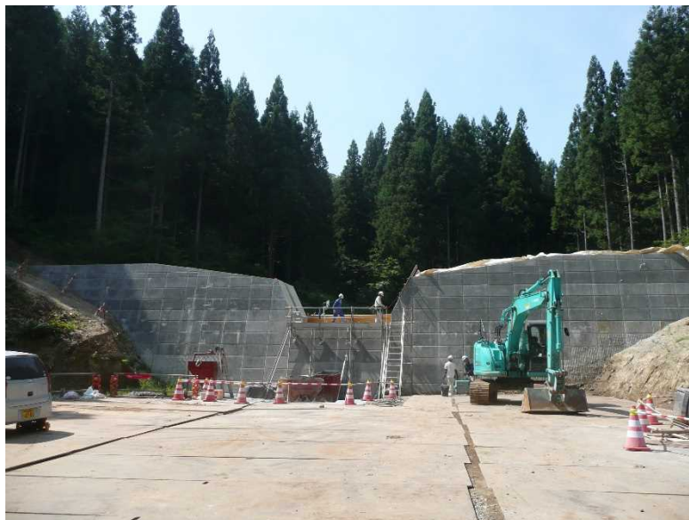
平成30年7月26日本堤水通し部型枠組立状況

平成30年7月下旬 穴沢2号砂防堰堤の本堤工がほぼ完成しました。残すは、水通し部のコンクリート打設です。 本堤部ができあがると前庭保護工の施工に入ります。