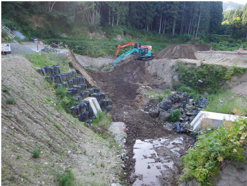
平成30年7月30日本堤工掘削状況