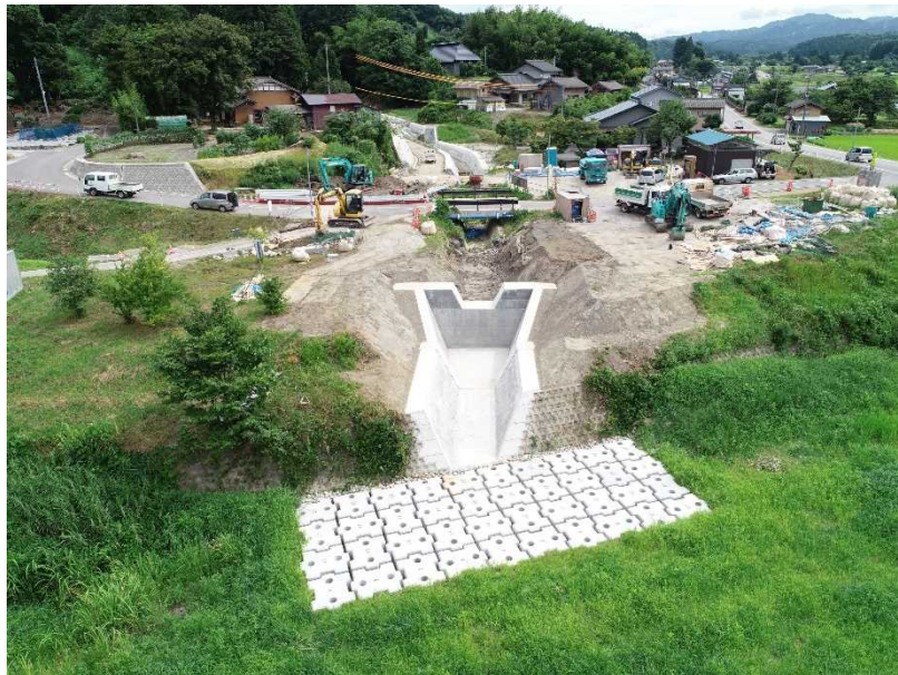
平成30年7月28日坂井川取り付け部完成状況