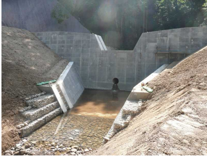
平成30年7月26日砂防堰堤完成状況

工期を平成30年8月31日まで延期しました。 7月下旬、砂防堰堤が完成しました。残すは、銘板、看板の設置及び敷鉄板等の撤去です。