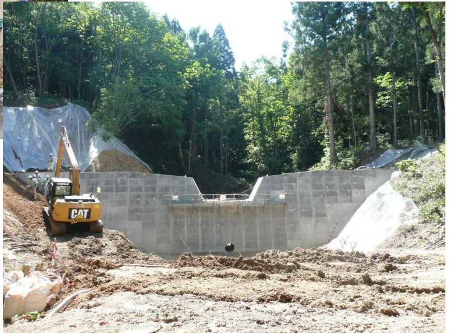
平成30年5月下旬前庭保護工部の掘削