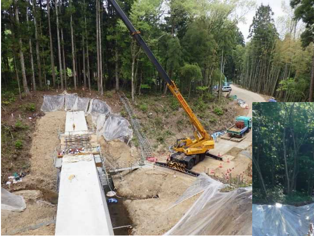
平成30年5月1日本堤部堤冠コンクリート打設