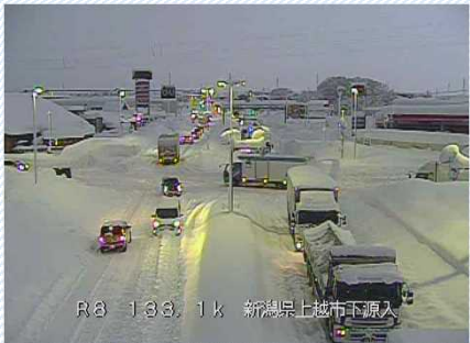
R3. 1. 10