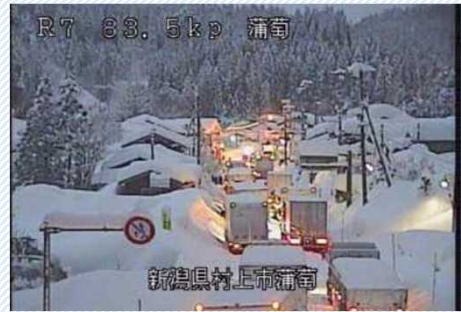
H30. 2. 6