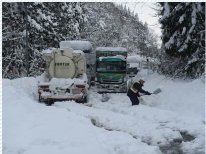
H30. 2. 6