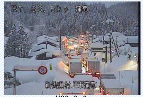
H30. 2. 6