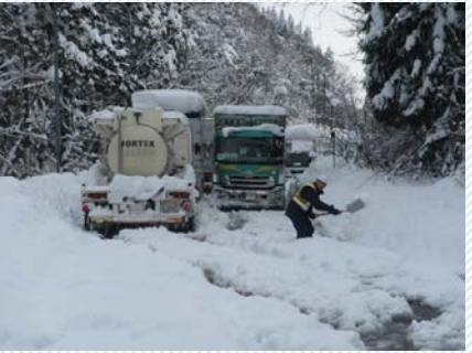
H30. 2. 6