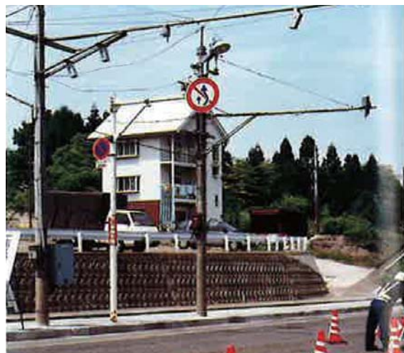
①路面積雪状況監視センサー

気象観測センサー（風向風速、気温、積雪深など）や路面積雪センサー、凍結感知器、CCTVカメラなどを用いて情報収集を行っています。