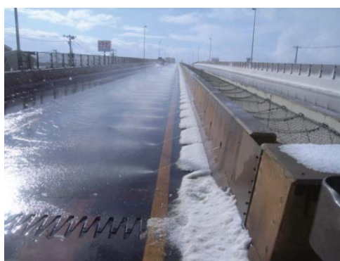
③壁高欄埋設の消雪パイプ