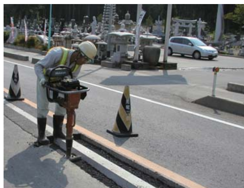
②消雪パイプの施工状況(プレキャスト)