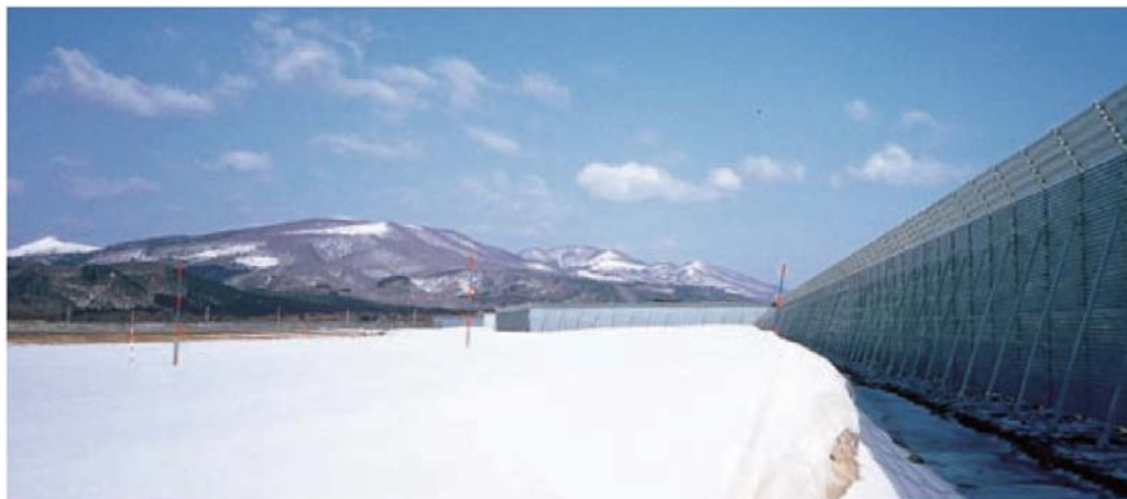
①吹き止め柵の設置状況

道路敷地内に設置できるので、道路上の防風効果、すなわち視程障害緩和効果も期待できます。