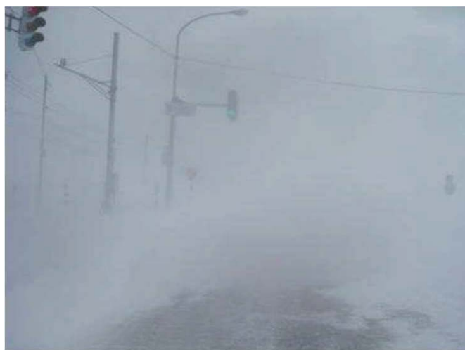
①地吹雪による通行障害

柵は風上の路肩近くに設置し、雪堤の成長を抑制するとともに、飛雪が路面すれすれに移動するため、視程障害の緩和にも効果があります。