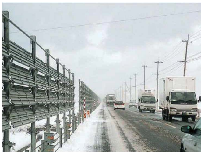
②吹き払い柵の設置による通行障害の緩和