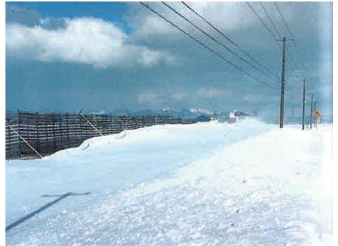
②柵による吹溜り状況