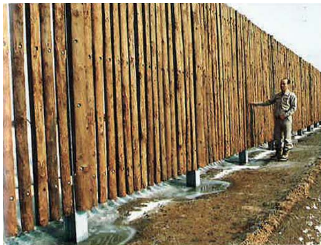
③天然木を用いた吹きだめ柵