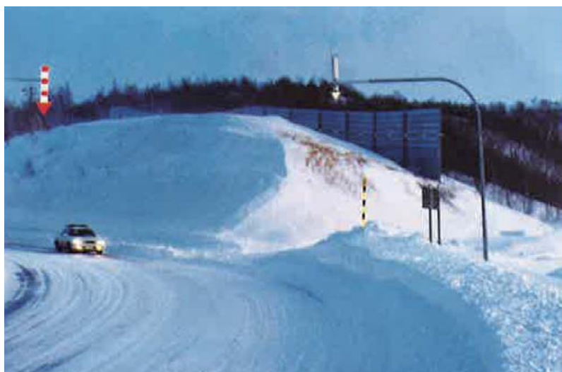
①雪庇予防柵（吹溜め型）

吹払い型は、吹き寄せる飛雪を補促するとともに、風の力で柵後部側の堆雪を防ぎます。