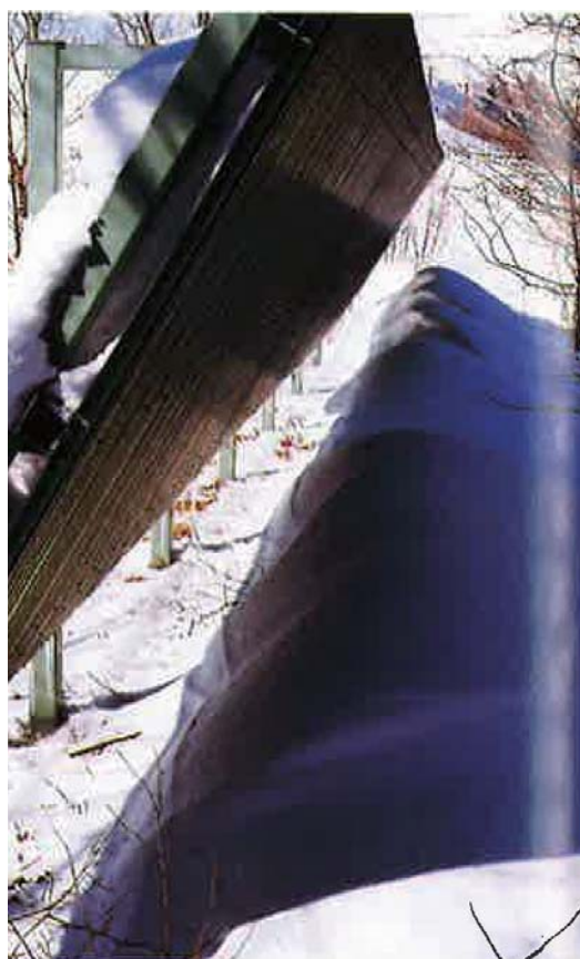
②雪庇予防柵（吹払い型）