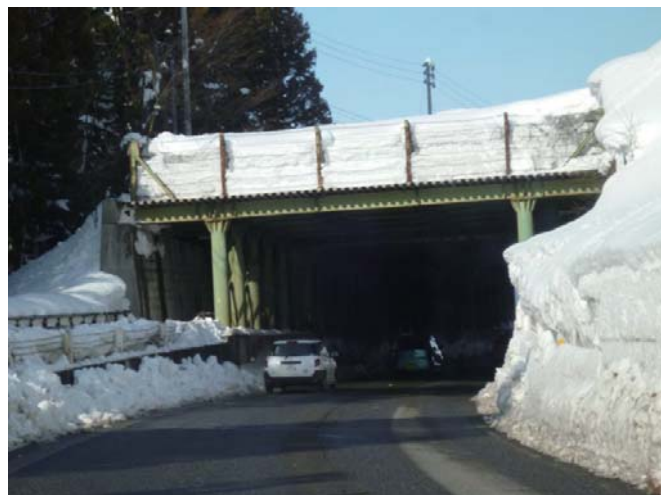
②スノーシェッドとせり出し防止柵