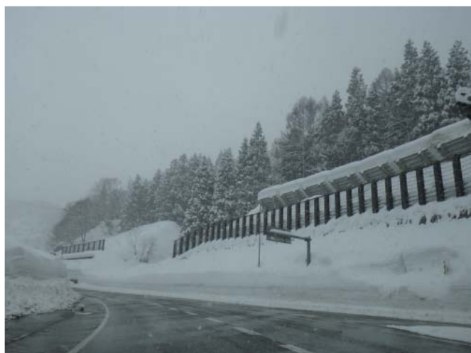
③雪崩予防柵とせり出し防止柵