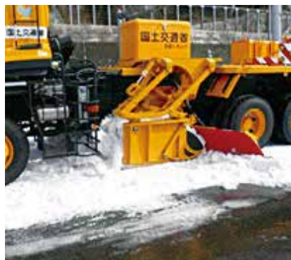
路面整正装置(シャッタ付)

路面に降り積もった雪が、通行車両に踏み固められると、圧雪になります。これが気温の上昇や車両のわだち掘れなどのため圧雪に凸凹が生じ、車両の通行に支障をきたします。路面整正作業は、路面の圧雪を除去、または圧雪の凹凸を削り取ることで平滑に仕上げ、通行車両の安全を確保することを目的に行います。