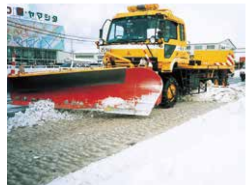
路面整正装置による圧雪の除去