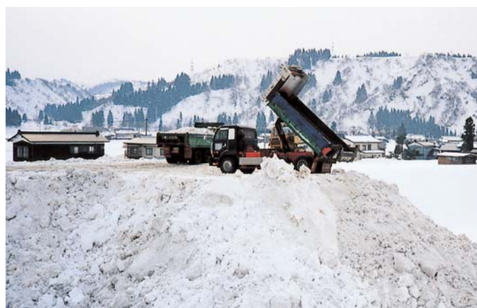
ダンプトラックによる雪捨て作業