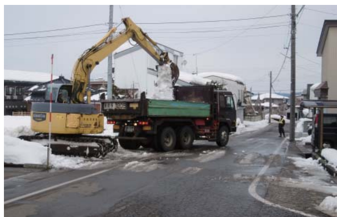
バックホウによる積み込み作業