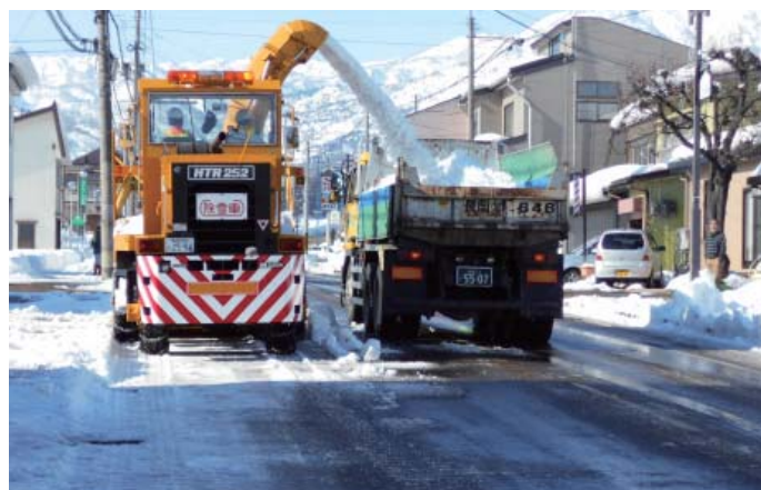
ロータリ除雪車による積み込み作業