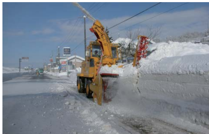
ロータリ除雪車による作業