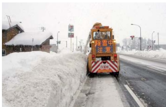
ロータリ除雪車による作業(拡幅後)