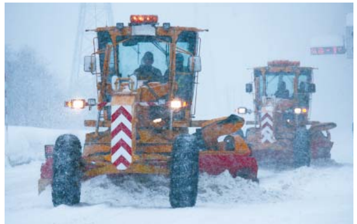
除雪グレーダによる作業