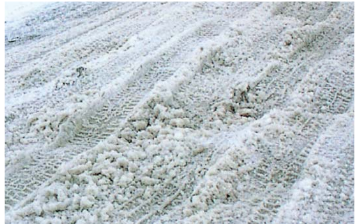
凹凸になった路面