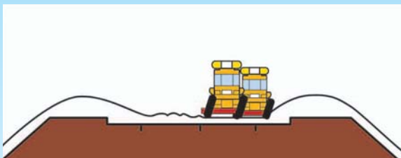
除雪トラックや除雪グレーダによる作業