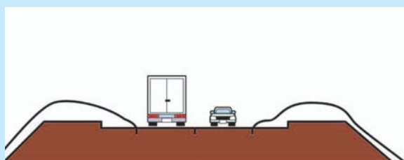
新雪除雪された路面