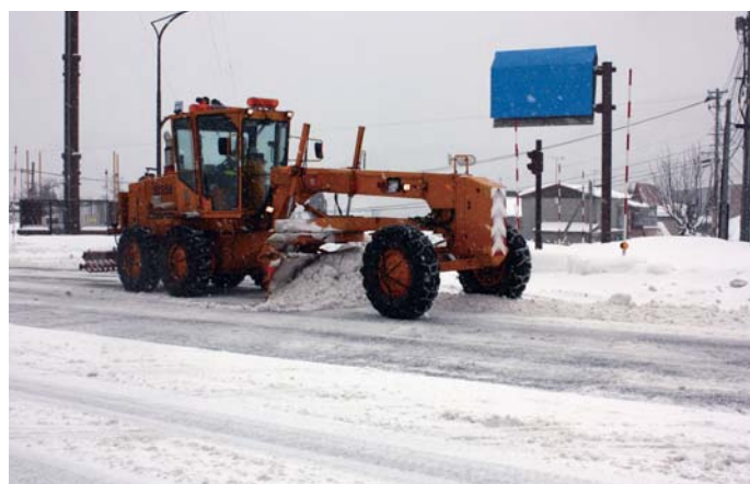
除雪グレーダによる作業