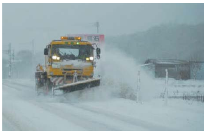
除雪トラックによる作業