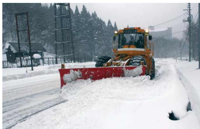
除雪ドーザによる作業