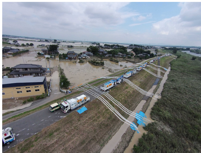
平成27年度関東・東北豪雨災害