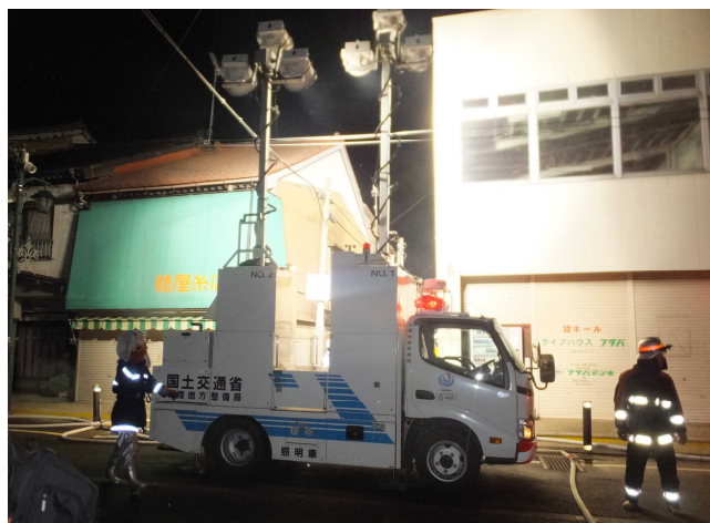
平成28年12月に発生した糸魚川大規模火災