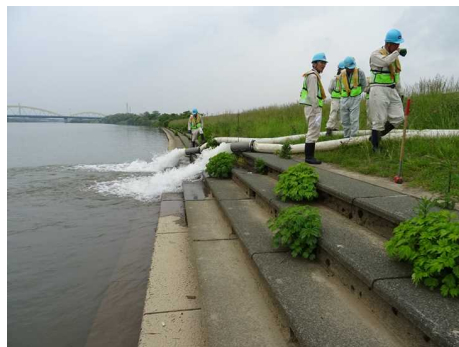
平成29年度の訓練状況