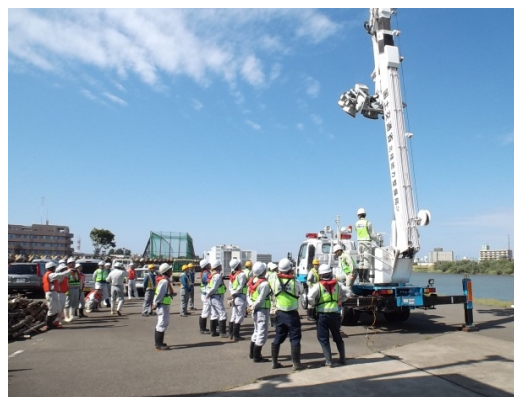
照明車操作訓練状況