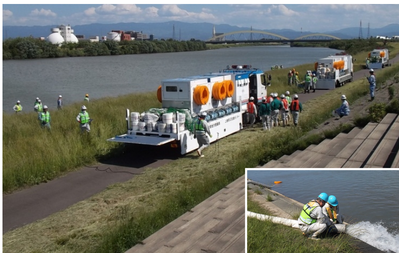
排水ポンプ車操作訓練状況