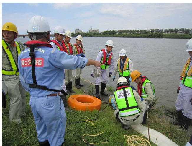
平成26年度の排水ポンプ車操作訓練状況

※なお、北陸技術事務所が風水害をはじめとする「注意体制」以上になった場合は、訓練を延期します。