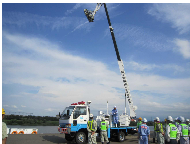
平成26年度の照明車操作訓練状況