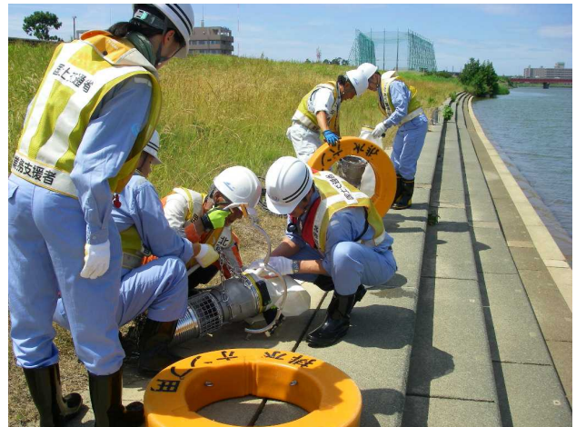
排水ポンプ車を使った排水訓練の例②