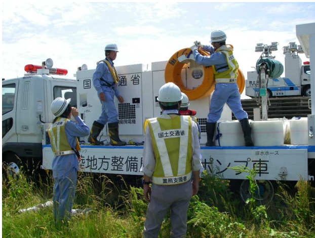
排水ポンプ車を使った排水訓練の例①

・日 時：平成26年8月20日（水）13：30～16：00まで（終了時間は予定） ・場 所：関川左岸 上越市塩屋地先 塩屋水防倉庫 ・使用機械：排水ポンプ車（60m 3 /min 高揚程） 2台、 照明車（2kW×6灯ブーム式） 1台、照明車（2kW×6灯 2柱式） 1台 ・訓練内容：排水ポンプ車及び照明車の設置、運転、撤去の一連作業 ※なお、風水害等の災害が発生した場合は訓練を延期します。