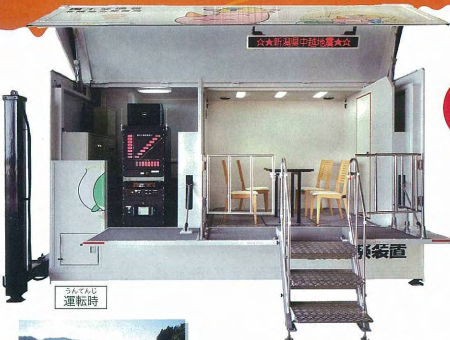
うんてんじ 運転時

災害の恐ろしさ、被害に対する備えを学習するため、実際の地震に近い揺れを体験する装置です。