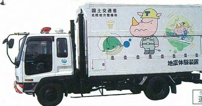
うんぱんじ 運搬時