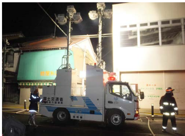
平成28年12月に発生した糸魚川大規模火災