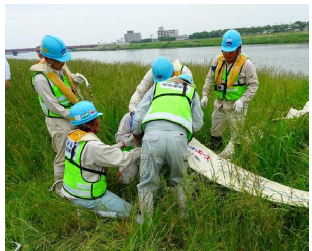
平成28年度の訓練状況