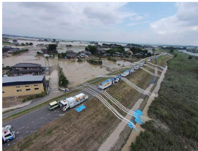
平成27年度関東・東北豪雨