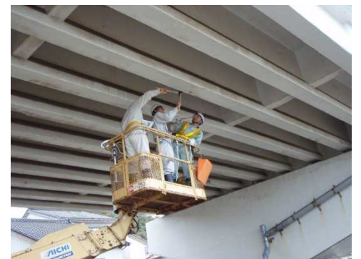
高所作業車を用いた 打音調査