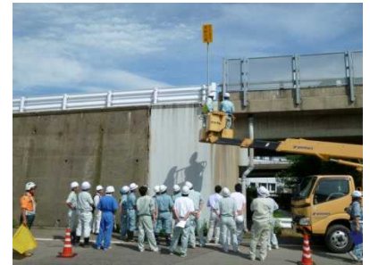
現地講習会イメージ