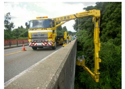
橋梁点検車を用いた点検