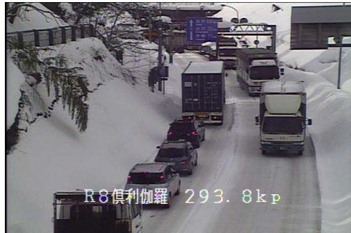
登坂不能車両と渋滞発生 (国道8号倶利伽羅峠 石川・富山県境)