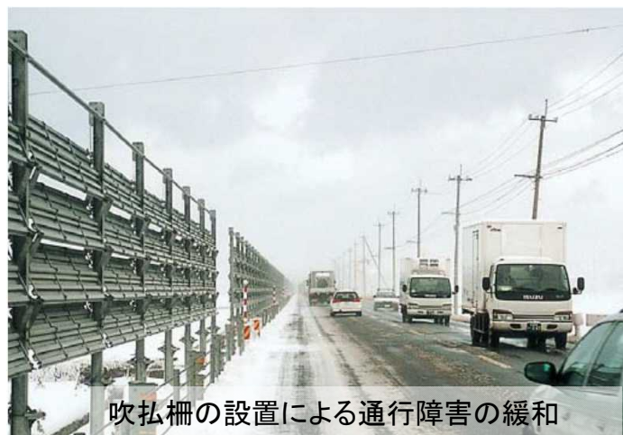
写真:国道116号、 新潟市西区小瀬