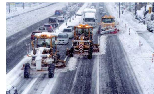
梯段除雪による迅速な除雪作業 (新潟バイパス)