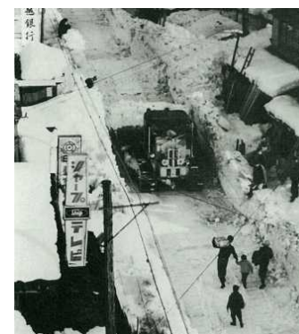
昭和30年代 道も家も 雪に埋もれ… (長岡市 関原地先)

除雪体制の拡充 38年豪雪時には約350kmであったものが、 現在では約1,000kmの除雪を実施