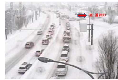
関越道通行止めの影響湯沢IC入口の渋滞 (国道17号新潟県南魚沼郡湯沢町)