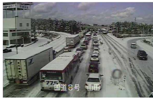
新潟都市圏での豪雪による交通障害 (国道8号新潟市西区山田付近)