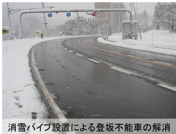
写真:国道17号、 南魚沼市石打