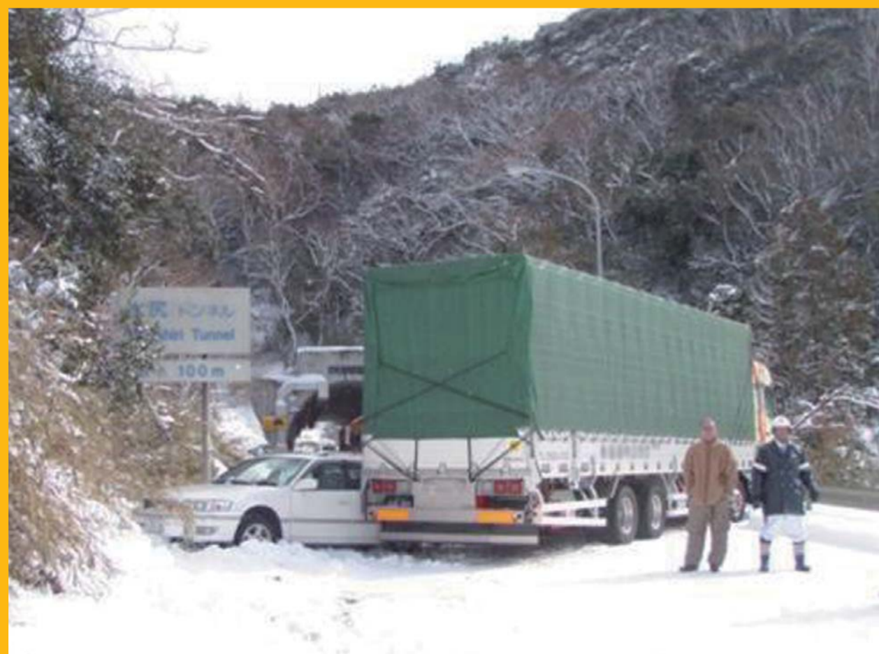
国道9号 鳥取県鳥取市気高町酒ノ津地先 平成23年1月30日