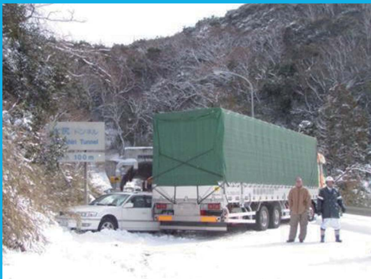
国道9号 鳥取県鳥取市気高町酒ノ津地先 平成23年1月30日