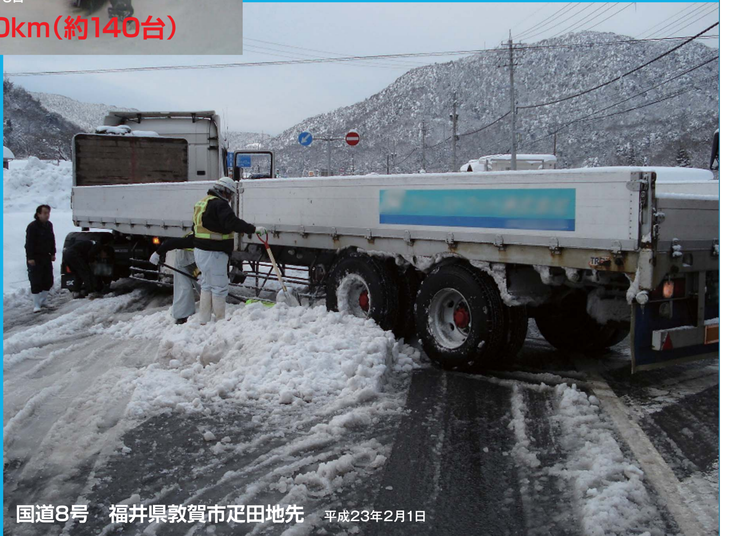
国道8号 福井県敦賀市疋田地先 平成23年2月1日

大型車のスリップ・立ち往生をきっかけに、 長時間の通行止めが発生しています。 冬用タイヤの交換・早めのチェーン装着を よろしくお願いします。