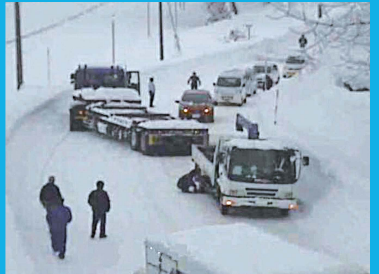
国道8号 新潟県柏崎市五十土地先 平成24年1月27日