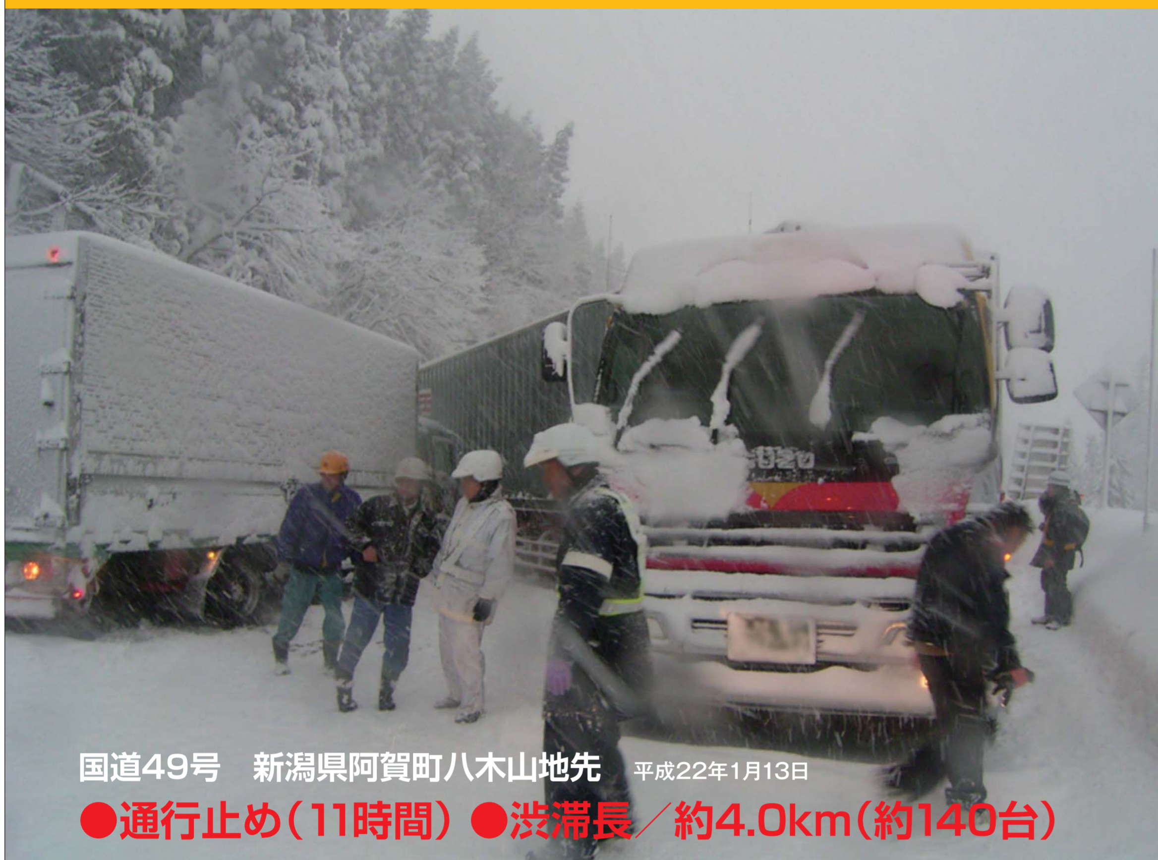
国道49号 新潟県阿賀町八木山地先 平成22年1月13日 ●通行止め(11時間) ●渋滞長/約4.0km(約140台)