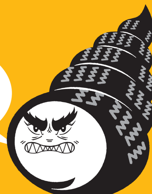
タイヤ換えたん貝