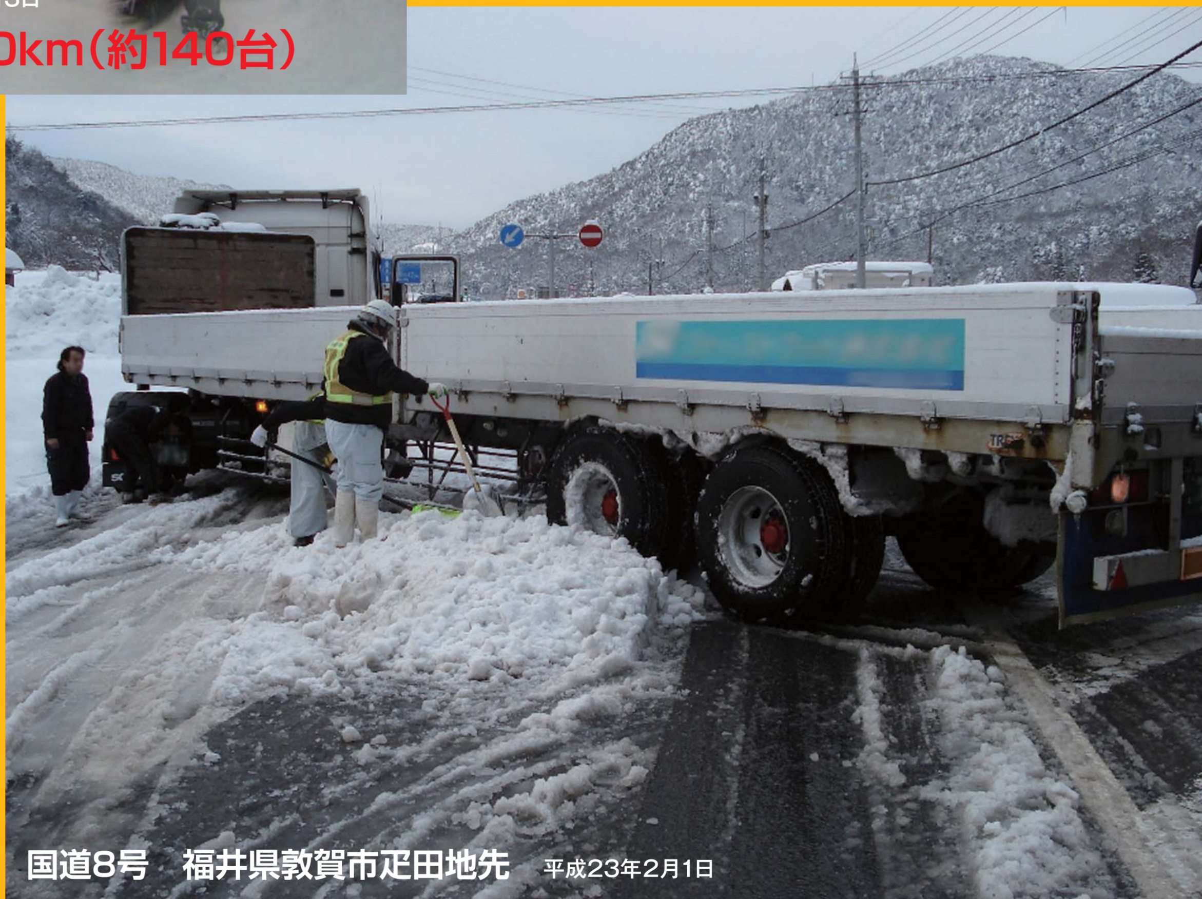
国道8号 福井県敦賀市疋田地先 平成23年2月1日

大型車のスリップ・立ち往生をきっかけに、 長時間の通行止めが発生しています。 冬用タイヤの交換・早めのチェーン装着を よろしくお願いします。