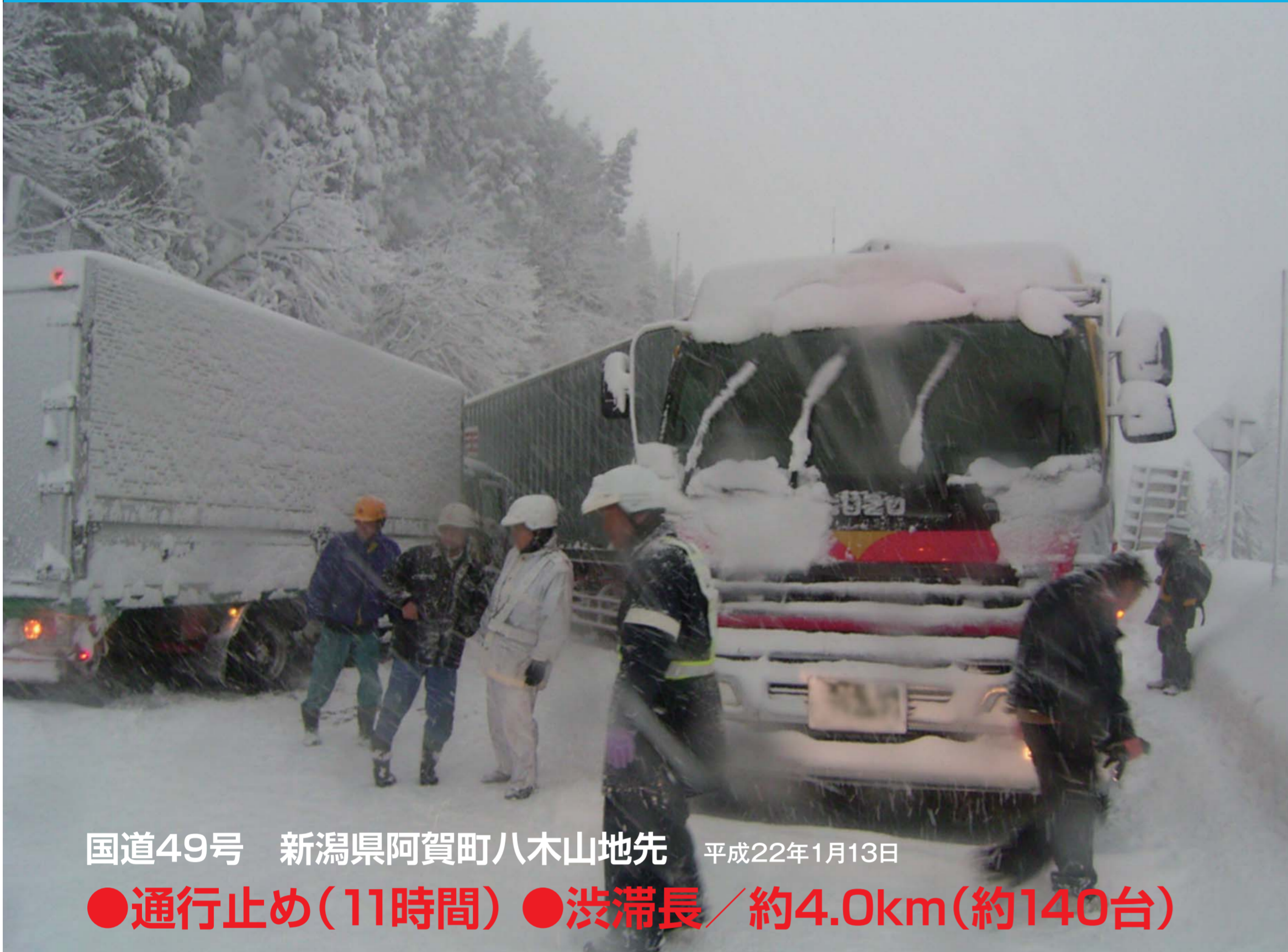
国道49号 新潟県阿賀町八木山地先 平成22年1月13日 ●通行止め(11時間) ●渋滞長/約4.0km(約140台)