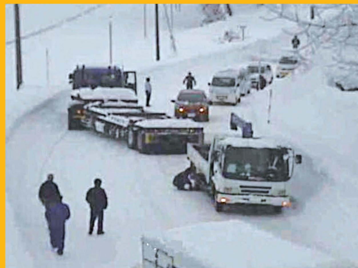
国道8号 新潟県柏崎市五十土地先 平成24年1月27日