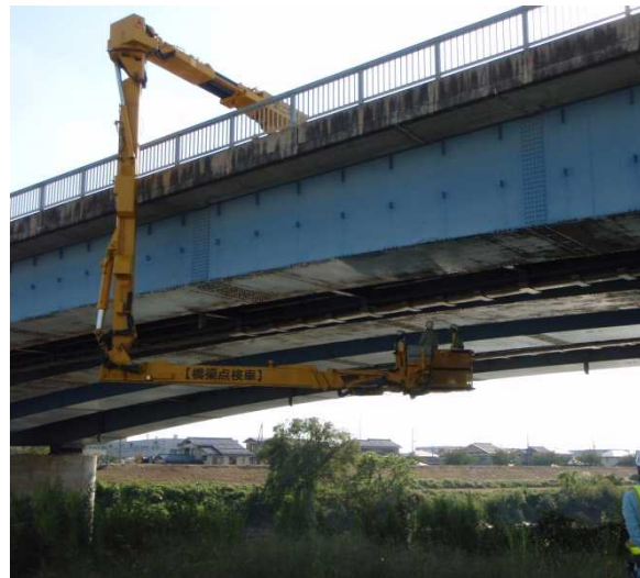
橋梁点検車での近接目視点検 (新潟県 三条大橋)