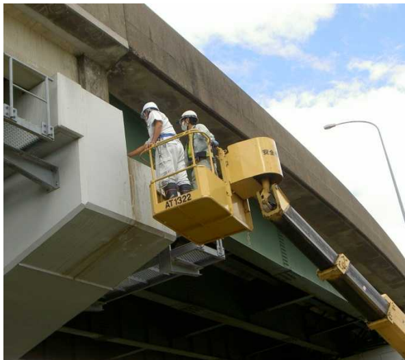
高所作業車での打音調査 (石川県 今町跨線橋)