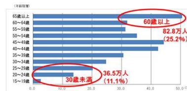
＜年齢構成別の技能者数＞