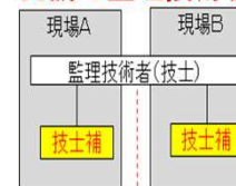
＜元請の監理技術者＞