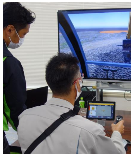
ICT関連企業と建設業者のマッチング体験会