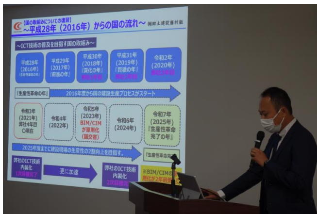
先進企業による講演