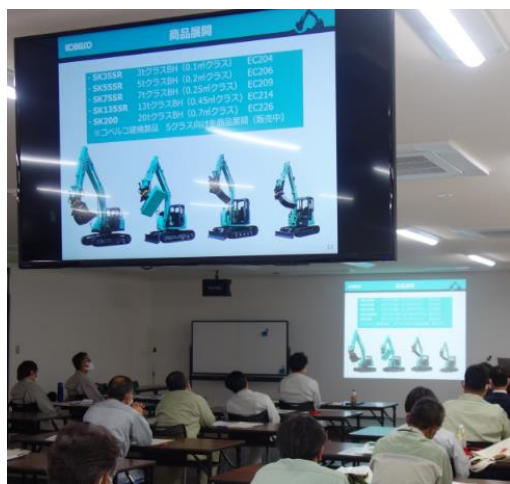
ICT関連企業による製品紹介