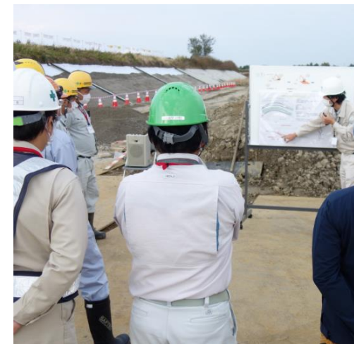
ICT活用工事の現場ツアー