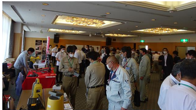
令和4年度 ICT活用工事普及マッチング体験会の様子