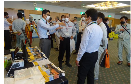
令和4年6月7日 新潟日報にも記事が掲載されました