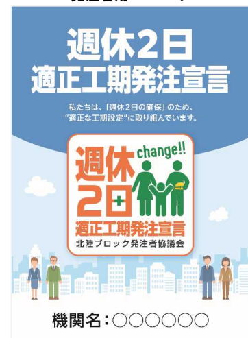
発注者用ポスター