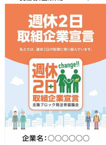
受注者(企業)用 ポスター