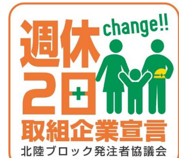
受注者(企業)用 ロゴマーク